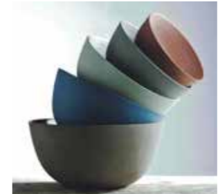
Abbildung: Giorgio Ricciardi

Schloßplatz 16 // 26122 Oldenburg Mo.- Fr. 9.30 - 18 Uhr, sowie am Samstag und Sonntag, den 04. und 05. August von 10 - 18 Uhr Telefon: 0441-361613-66 // Fax: 0441-361613-55 info@oldenburg-tourist.de // www.oldenburg-tourismus.de