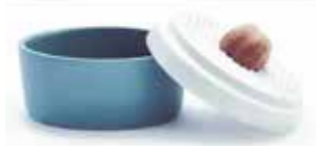
Abbildung: Pfeifer & Salzwedel

Ausgesucht schöne Dinge in originellem Design aus Irdenware, Steinzeug oder Porzellan stehen für das hohe Qualitätsniveau des europaweit renommierten Marktes, der einen erstklassigen Querschnitt durch die zeitgenössische keramische Kunst und das gegenwärtige keramische Handwerk zeigt.