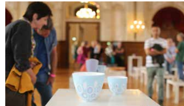
Schlosssaal | Best-of-Ausstellung „Brandneu - brandnew“

04.08. - 05.08.2018 Oldenburger Schloss Samstag von 11.00 - 18.00 Uhr Sonntag von 10.00 - 17.00 Uhr