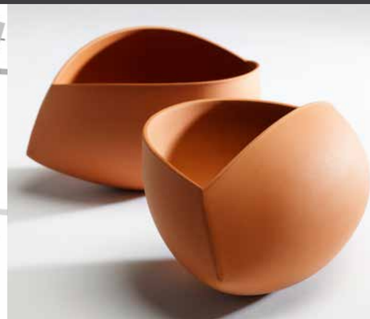
Abbildung: Ann van Hoey